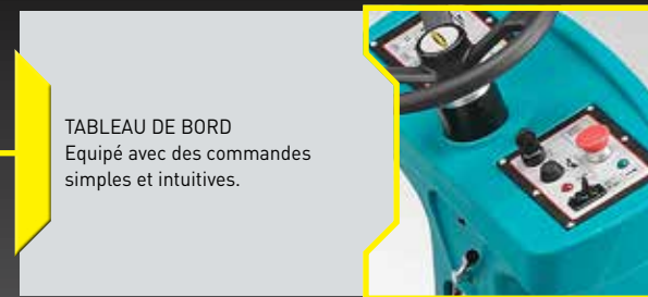
TABLEAU DE BORD Equipé avec des commandes simples et intuitives.